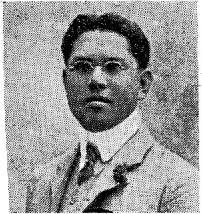
Baginda Almarhum Sultan Ibrahim ketika masih muda.