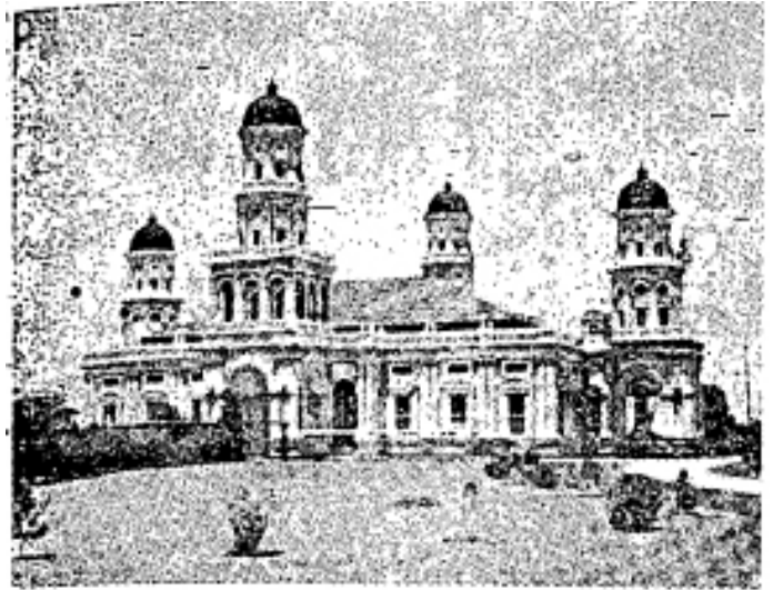
Masjid Sultan Abu Bakar Johor,

Jalan-jalan raya telah dibuka di merata-rata negeri. Perhubungan telefon dan telegraf, saluran air dan